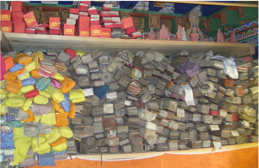
སྐྱང་སྟེང་རིན་པོ་ཆེའི་སྐུ་སྟེང་དཔེ་མཛོད། ཤེས་རྒྱན་གྱི་པར། Gangteng Rinpoche's private library (Photo by Shejun)