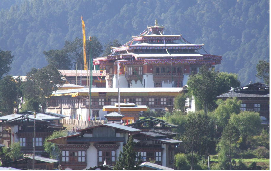
དཔལ་སྐྱང་སྟེང་གསང་སྟེང་ཚོས་སྒྲིང་གི་གཞུག་ལག་ཁང། ཀམ་ཕུན་ཚོགས་ཀྱི་པར། Gangteng Sa-ngag Chöling (Photo courtesy Karma Phuntsho)