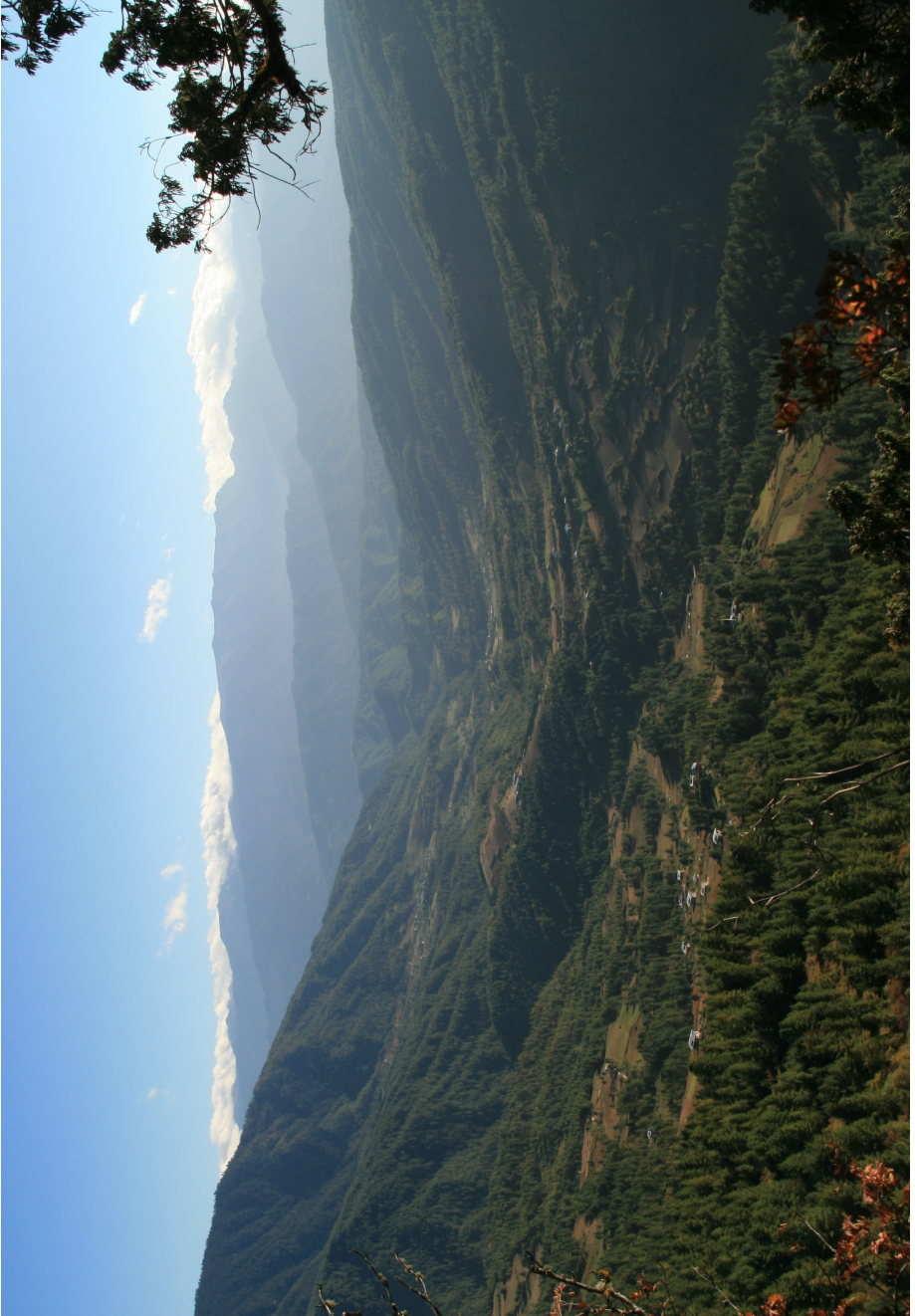
སྤང་ཆལ་གཞོང་། ཀམ་ཕུན་ཚོགས་ཀྱི་པར། Chel, Tang (Photo courtesy Karma Phuntsho)